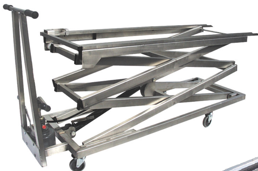
Système de rouleaux porte cercueils